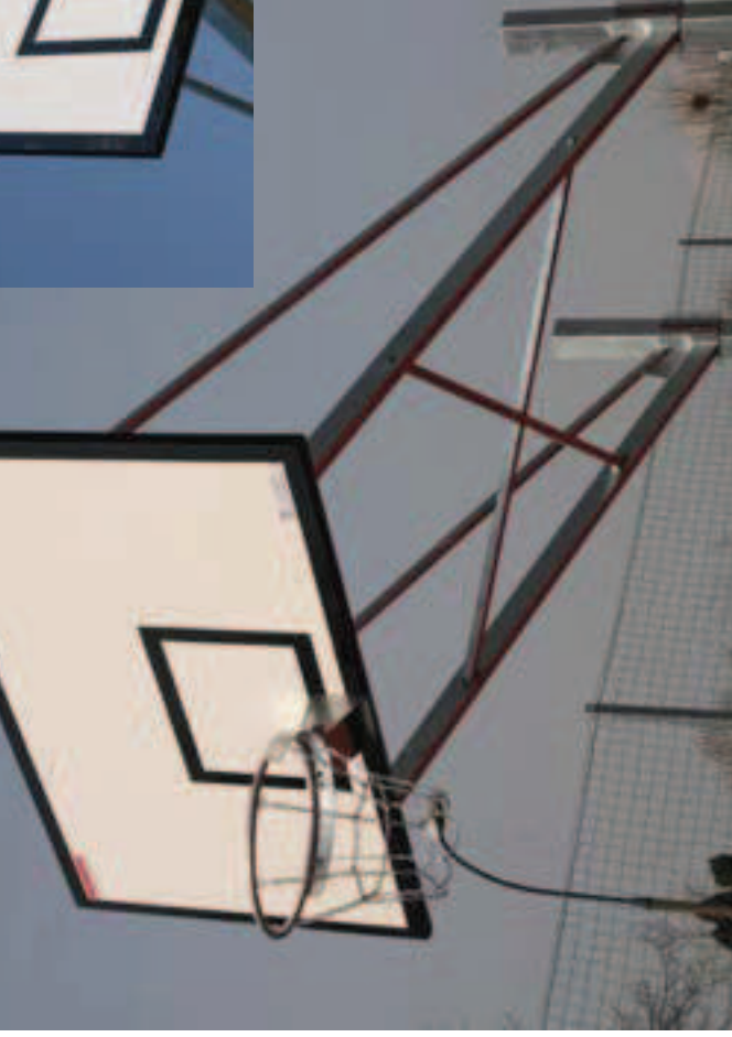
Art. nr 1-83, 1-84